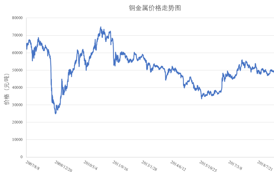
图 6-1 铜金属价格走势图