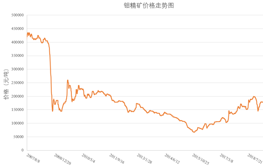
图 6-2 钼精矿价格走势（数据来源：亚洲金属网）